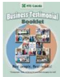
Le Livret de Témoignages AX0069 22.50$ pour 10 exemplaires