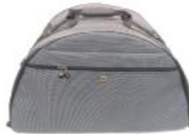
Sac pour le HotHouse® ASY010001 90$ avec 2 VPA Sac Grande HotHouse® ASY010002 100$ avec 2 VPA