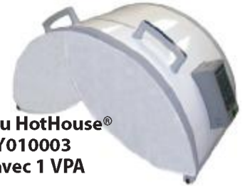
Le rideau HotHouse® ASY010003 45$ avec 1 VPA