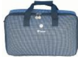
Sac pour E-power ASE018012 45$ avec 1 VPA