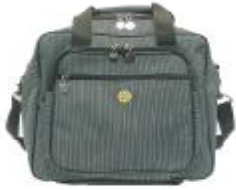
Sac pour la Chi Machine® ASS001001 45$ avec 1 VPA