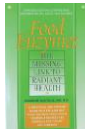
Les enzymes alimentaires - Le Lien manquant pour une santé rayonnante ANS003011 10.50$