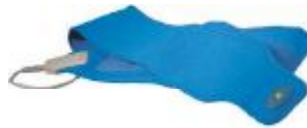
La ceinture E-power SE019 163.50$ avec 5 VPA