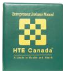
Le Livret d'Entrepreneur Ang. - ABA002002 Fr. - ABA002004 27$