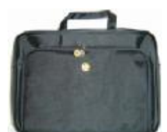
Sac d'entrepreneur ABA002001 30$ Excellent pour le livret d'entrepreneur