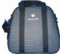
Sac pour ERE Avancé® ASE002002 45$ avec 1 VPA