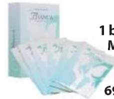
1 boîte de Bianca Masque Facial (6 pièces) CX013A 69$ avec 3 VPA