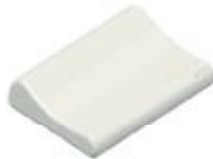
L'oreiller du Grand Lit SOQI ASB001029 39$ avec 1 VPA