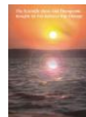
Les bases scientifiques et bienfaits thérapeutiques des soins à Rayons Infrarouges lointain ABC001031 $12.00